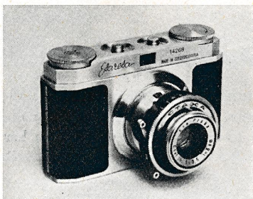
(Fig. 3) „Etareta“.

ETARETA er i Formatet 24 \times 36 mm. Det leveres med Taske og Anastigmat 3,5 og optisk Gennemsigtsøger og koster 463 Kr.