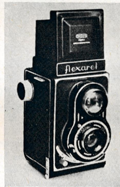
(Fig. 2) „Flexaret“.

Analysevægte, Fotografiapparater, Forstørrelsesapparater, Tonefilmsgengivere, Barometre, og meget mere, men hvad der for os har den største Interesse, er den fotografiske Del af